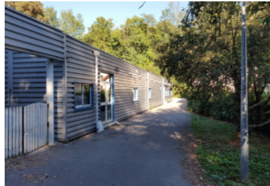
Vue extérieure de l'existant

L'état existant au niveau du confort d'été et d'hiver n'est pas satisfaisant. Une importante rénovation thermique est intégrée au projet (remplacement des menuiseries, surisolation des façades et de la toiture). De même, tout le réseau de ventilation est repris afin de réduire les charges de fonctionnement par la diminution de la facture énergétique.