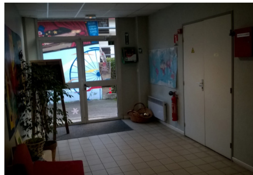
Vue intérieure de l'existant