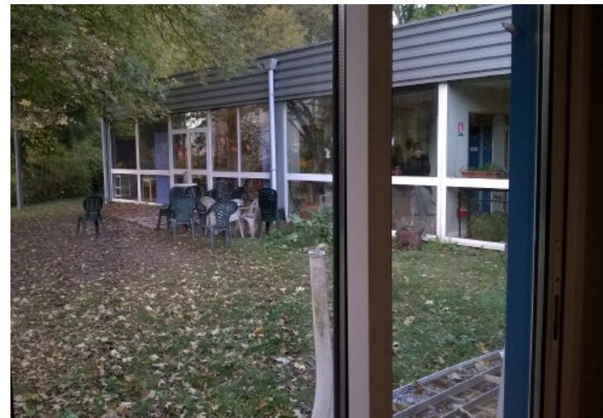
Vue extérieure de l'existant