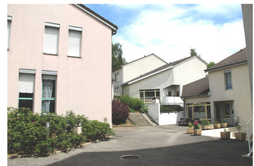
Photographies de l'existant