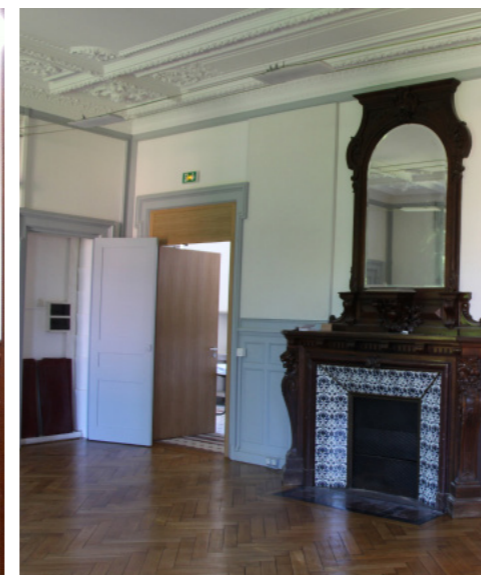
Avant / Après travaux de mises aux normes intérieur