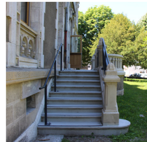
Avant / Après travaux de mises aux normes extérieur