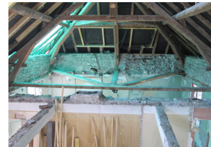
Photos des travaux