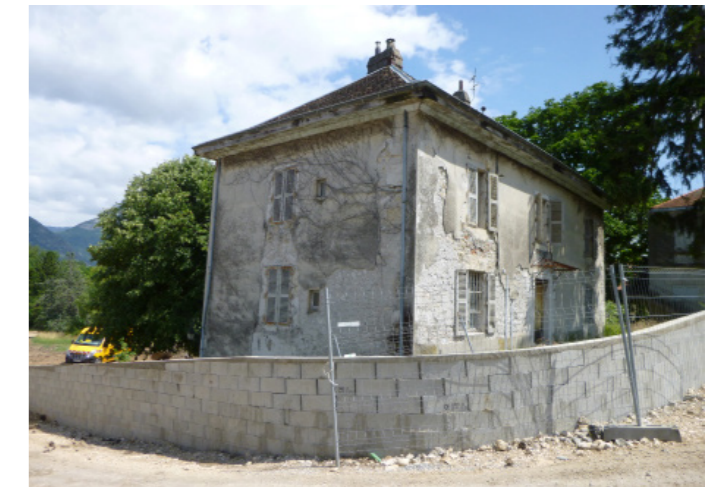
Photo de l'existant