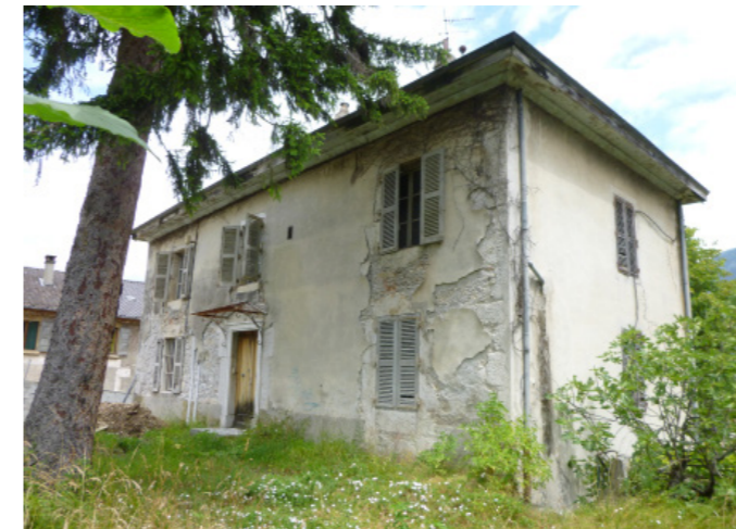
Photo de l'existant