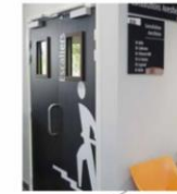
Exemple de signalétique

Permet l'autonomie du public, temps gagné