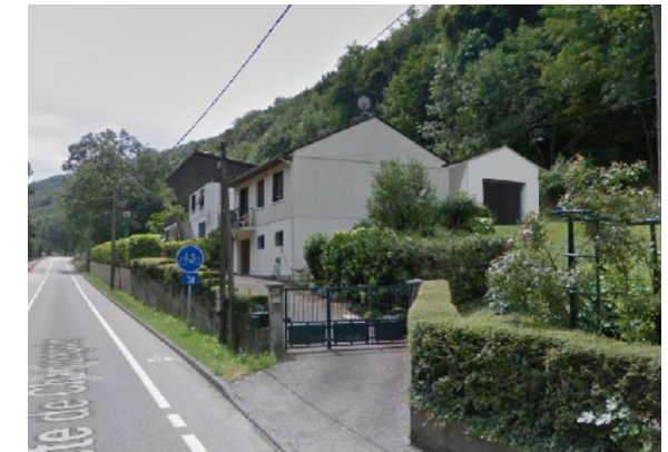
Vue depuis la rue ▲ Avant ▼ Après